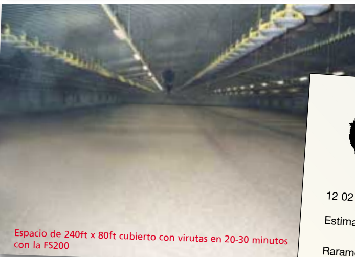
Espacio de 240ft x 80ft cubierto con virutas en 20-30 minutos con la FS200